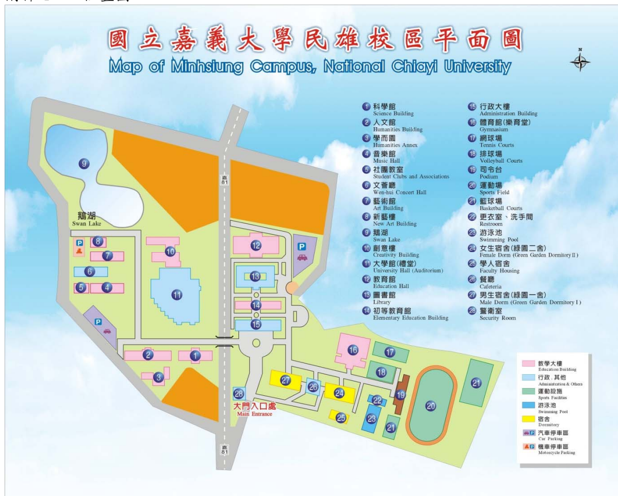
附件 4 位置圖